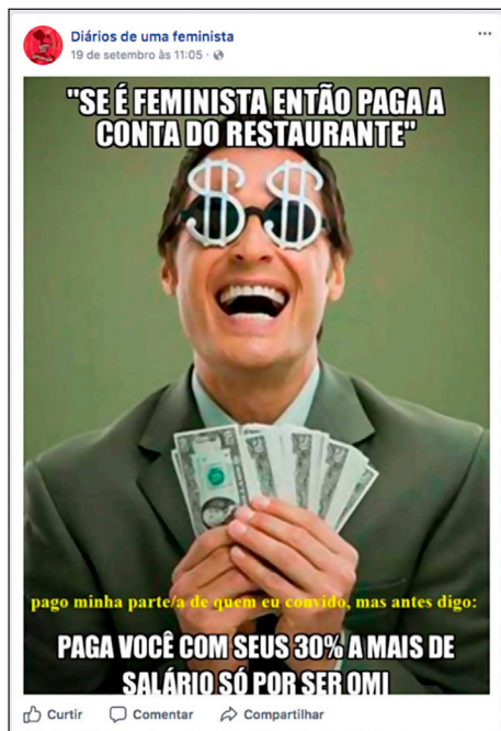
Figura 2 – Publicação feita pelo moderador da página “Diários de uma feminista”.