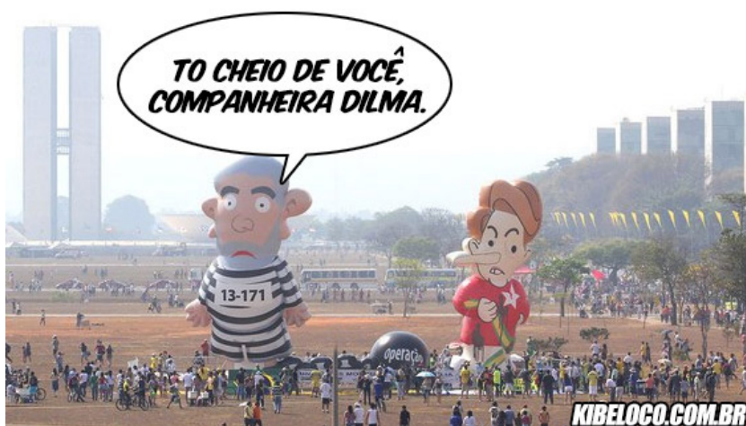
Figura 5 - Fotomontagem feita a partir de fotografia veiculada na mídia por ocasião da comemoração da Independência do Brasil