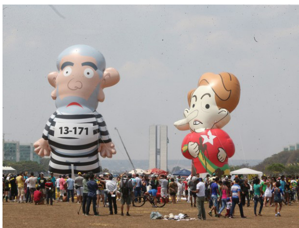
Figura 6 - Fotos dos bonecos infláveis veiculada na mídia impressa e em reprodução on-line por ocasião das comemorações da Independência do Brasil 17

em Brasília, bonecos infláveis representando o ex-presidente Luiz Inácio Lula da Silva – com roupa listrada, de presidiário – e a presidente Dilma Rousseff. Os bonecos foram exibidos simultaneamente ao desfile oficial do 7 de Setembro, do qual Dilma e ministros participavam 16 .