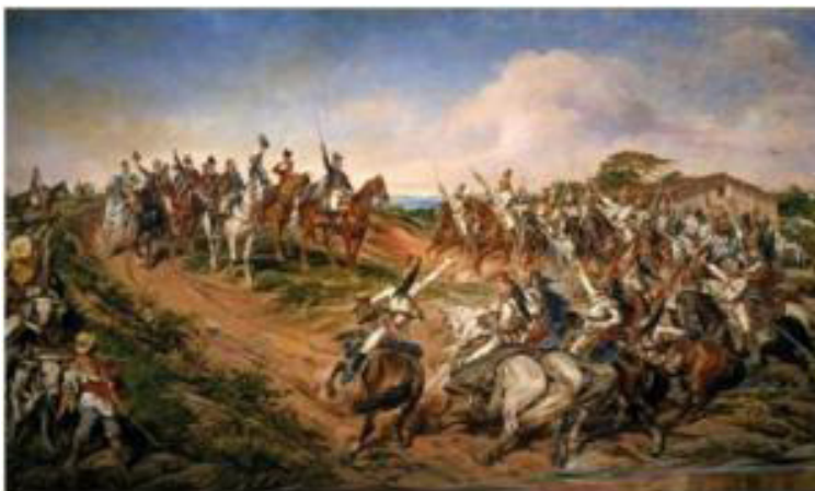
Figura 1 - Independência ou Morte, de Pedro Américo (1888)- Óleo sobre tela, 4,15m x 7,60m.