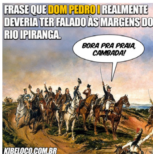
Figura 2 - Fotomontagem do blog Kibeloco feita a partir do quadro “Independência ou Morte”, de Pedro Américo