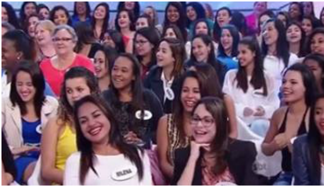
Figura 3 - Imagem que dá entrada ao vídeo do programa de auditório de Sílvio Santos

dem vir de outras mídias como a TV. Assim, o blogueiro se apresenta como um sujeito competentemente firmado na mediação contínua. Ele quer e sabe blogar , o que convoca, juntamente com o poder de acesso à tecnologia digital, o gosto pela interatividade estendida sob o efeito de sentido de multiplicação actorial ad infinitum , o que é favorecido pelo aparato material da Web . No blog Kibeloco , no dia 03 de setembro de 2015, como consta do cabeçalho da edição consultada, Kibeloco – ao postar, juntamente com a imagem (que serve de porta de entrada para a visualização a ser feita do vídeo), a cena do programa de auditório Sílvio Santos (SBT) e, no que seria chamado no âmbito do jornalismo tradicional como lide, ao postar esta frase: “Volta e meia Sílvio Santos nos lembra por que virou um mito” 14 – favorece o subtendido da pergunta retórica, viabilizando o querer , o poder e o saber que antecedem o ato de participação efetiva do sujeito que intervém no blog como comentador.