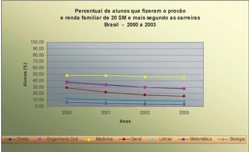
Gráfico 1 – Carreiras especiais e renda acima de 20 SM – Brasil – 2000/2003