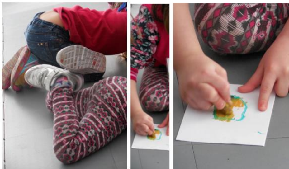
Figura 2: Foto-Ensaio - O corpo que desenha

Fonte: Acervo pessoal - Composto por duas fotografias digitais