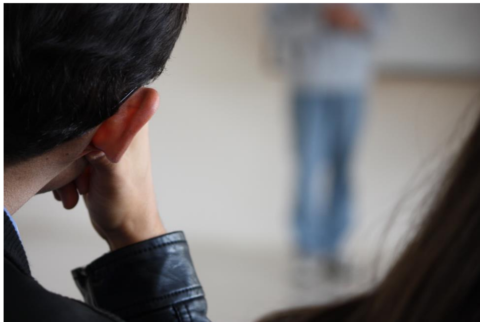
Figura 4: Foto-Ensaio - Espaço educativo: a aula

Una metodología de investigación fotográfica basada en artes utiliza las calidades estéticas fotográficas como instrumento fundamental de investigación. Esta investigación será educativa cuando sus métodos y objetivos se apliquen a la resolución o plan de problemas en el campo de la educación. [...] Lo que caracteriza el trabajo de las investigaciones fotográficas es el hecho que trabajan la descripción, el análisis y la generación de nuevas situaciones que se puedan ver desde otro ángulo. (ROLDÁN. 2012, p. 56).