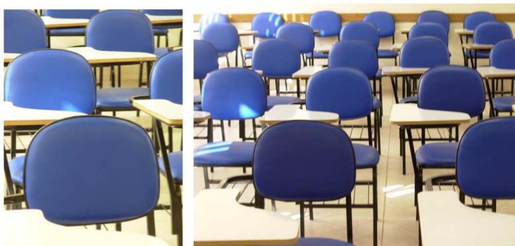
Figura 5: Foto-Ensaio - Espaço educativo: a sala de aula.

Al seleccionar los instrumentos visuales de la investigación, hay que considerar cuáles son los elementos de nuestro interés. Qué variables y cómo se pueden arreglarlas, cuáles estrategias son útiles y finalmente, cuál es la técnica más adecuada. Entonces, la utilización de la fotografía en la investigación presupone tomar decisiones sobre: 1) el referente (objeto de investigación); 2) cómo hacer (cuáles acciones, en qué tiempo, etc.); 3) contexto visual (dónde, como); 4) revelar visualmente su mirada de investigador y 5) poner en duda lo que se ve (punto de vista crítico).