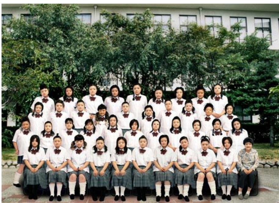
Figura 1: Citação visual literal