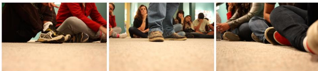
Figura 3: Foto-Ensaio - Espaço educativo: o museu

En ese sentido, Marin Viadel y Roldán (2012) cuestionan cómo ver (literal) mejor los problemas educacionales; cómo miramos (visual) esos problemas y cómo podemos imaginar nuevas soluciones educacionales para el desarrollo personal y social. Para esos autores, “una investigación educacional basada en la fotografía es la que utiliza imágenes y los procesos fotográficos para indagar sobre los problemas relacionados a la enseñanza y el aprendizaje” (2012, p. 42).