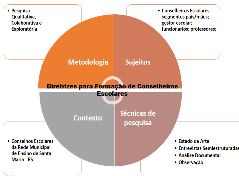
Figura 1 – Matriz metodológica de la investigación

Los principales fundamentos teóricos y el recorrido metodológico adoptados en la investigación están delineados a continuación (Figura 1):