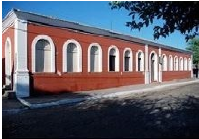
Figura 1 – Fachada reciente del edificio donde funcionaba el Asentamiento Rural de São Pedro de Alcântara

El Establecimiento Rural São Pedro de Alcântara, en Floriano, es un importante testigo de la ocupación del interior de Brasil a lo largo de los siglos XVIII y XIX. Con imagen reciente de la institución, se puede visualizar sus características de arquitectura externa: