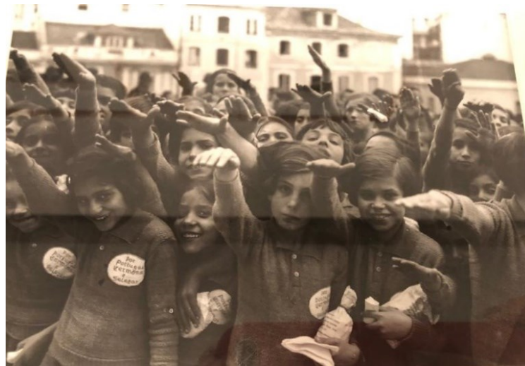
Figura 3 – Niños de los asilos y escuelas de Lisboa en 1889