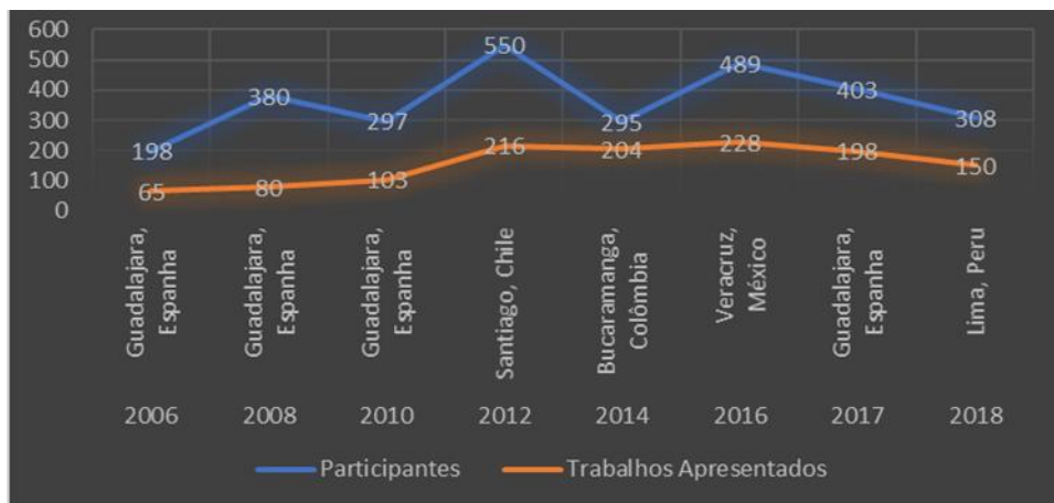
Figura 03 – Participantes e trabalhos apresentados nos EIDEs ocorridos no exterior