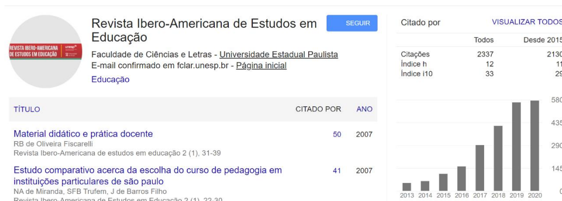
Figura 01 – Dados bibliométricos da RIAEE no Google Scholar