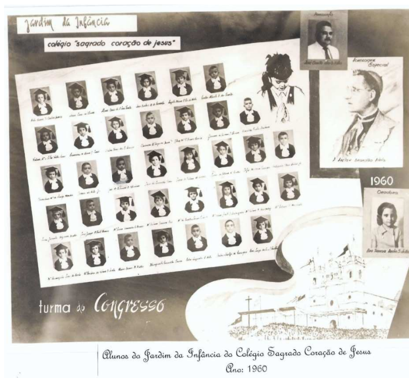
Figura 2 – Cuadro de graduación - Jardim de Infância de 1960 7 (Turma do Congresso)