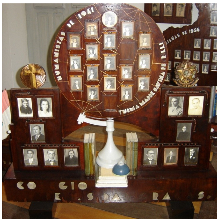
Figura 1 – Cuadro de graduación-humanistas 5 de 1941 (Turma Madre Savina)