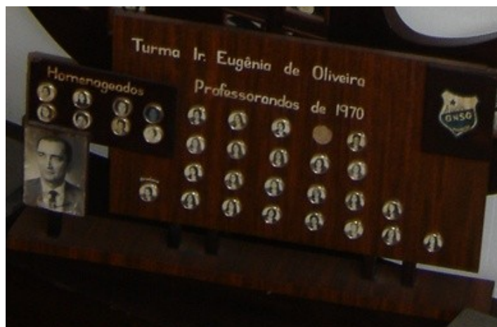
Figura 4 – Cuadro de graduación – professorandas de 1970 (Grupo Irmã Eugênia de Oliveira)

Foto: Márcio Iglésias (jul. 2008) – Acervo Colégio Nossa Senhora das Graças