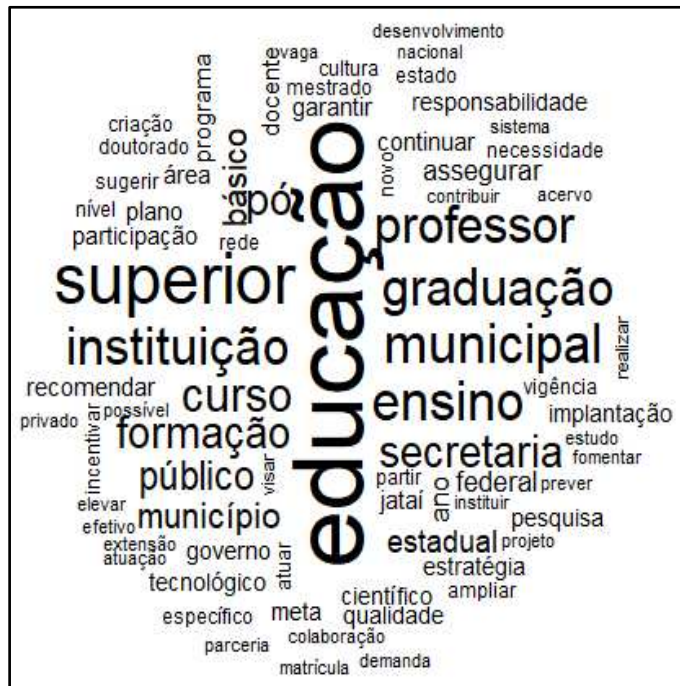
Figura 1 - Nube de palabras del Plan Municipal de Educación de Jataí

Fuente: Elaborado por los autores (2020) a partir del Plan Municipal de Educación de Jataí (2015) 4