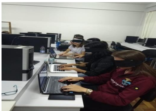
Figura 3 – Intervenção prática: atividade testando o teclado

A Figura 3 apresenta o momento da intervenção realizada com os professores com os olhos vendados.