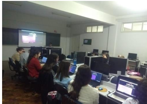
Figura 4 – Intervenção prática: apresentação da TA – Dosvox

A Figura 4 apresenta o momento da intervenção sobre a TA – Dosvox para os professores sem o uso das vendas: