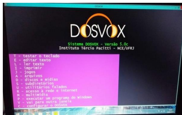
Figura 1 – Tela do Sistema Dosvox versão 5.0c

A Figura 1 apresenta alguns dos programas contidos na versão 5.0c da TA – Dosvox .