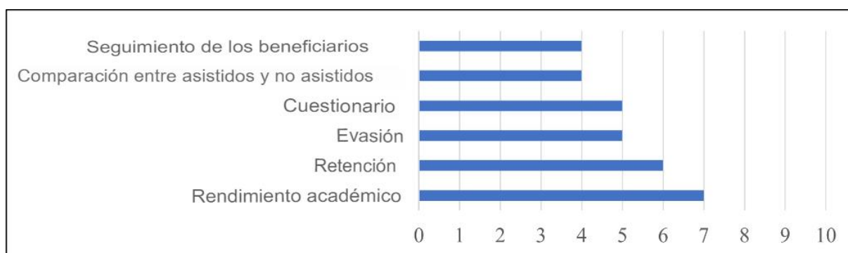
Gráfico 3 – Principales mecanismos de evaluación utilizados por las universidades federales