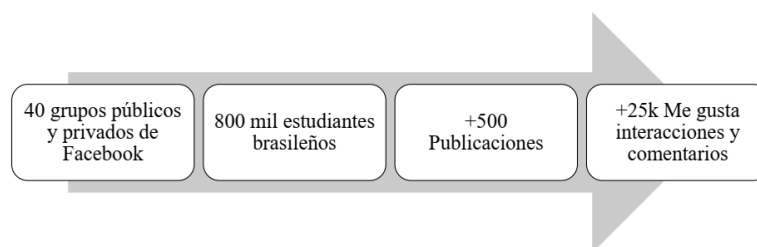
Figura 2 – Datos recopilados de las Redes Sociales

alrededor de 25,000 interacciones de los tipos de me gusta y comentarios (Figura 2). Recopilamos videos disponibles en 2 canales de Youtube con cerca de 700 suscriptores, identificados a partir de comentarios en grupos de Facebook , identificando 18 videos, publicados entre 2019 y 2020, que fueron vistos más de 8,300 veces, y con 668 interacciones de los tipos de me gusta y comentarios (Figura 3). Las redes sociales permitieron en nuestro estudio el aumento en el número de países y experiencias de internacionalización, permitiendo la exploración del lenguaje hablado y escrito, contribuyendo a la validez interna de nuestra investigación (YIN, 2015).