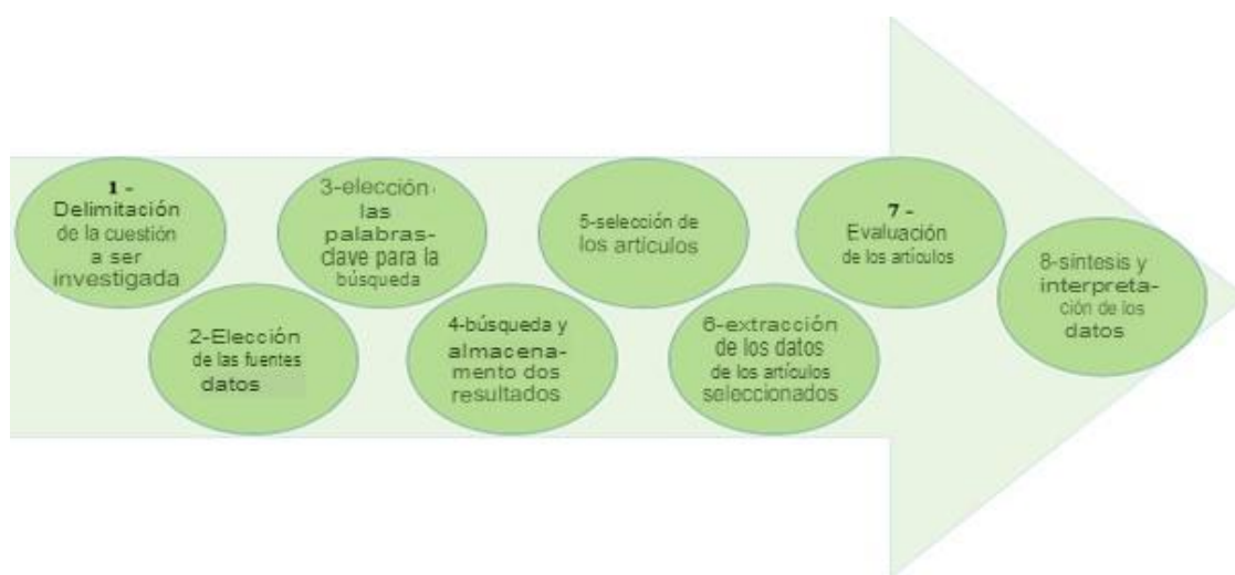
Figura 1 – Esquema de las etapas del recorrido metodológico de la Revisión Sistemática