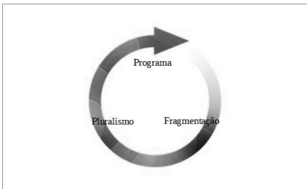
Figura 2 – Alternância entre programas de pesquisa e pluralismo