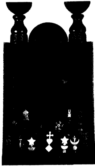
Figura 3. Ronaldo Rêgo. Oratório .