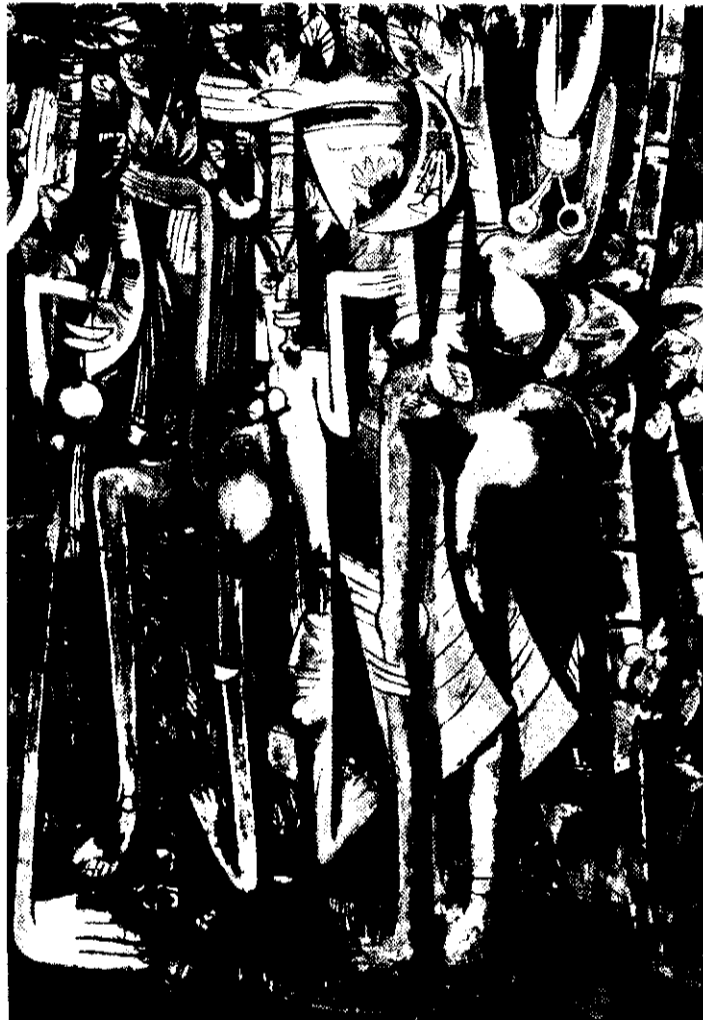
Figura 1. Wifredo Lam. La jungla , 1942-1944 (detalhe).

Um contraponto aos painéis híbridos de Lam poderia ser buscado no “ réalisme merveilleux ” haitiano, visto por Jacques Stéphen Alexis como uma estética intuitiva, assumida pelo povo para apreender a realidade, filtrada já por tendências próprias às culturas americanas. Ainda que essas tendências apontem para a intenção de (re)nomear espaços do Novo Mundo a partir da diferença que os constitui, cada uma delas enfatiza significantes múltiplos e feições plurais, pois o ideograma buscado é sem dúvida o da mestiçagem.