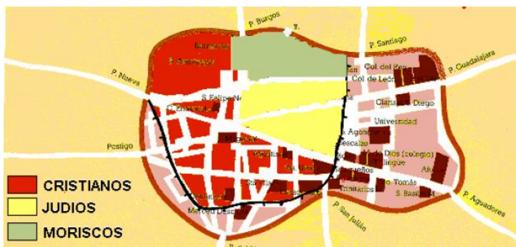
Figura 2 – Croquis de la Alcalá medieval como Ciudad del saber y de la convivencia de las tres culturas