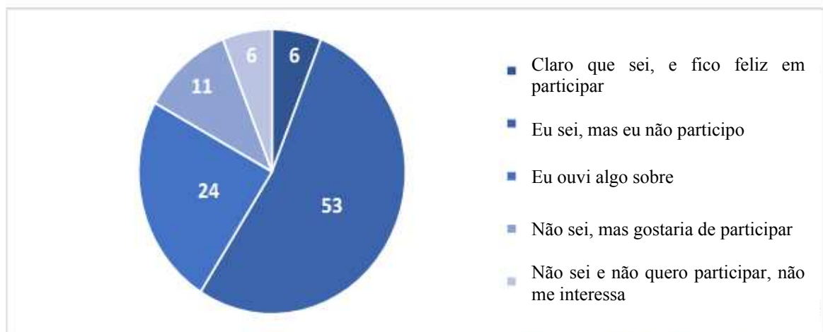
Figura 1 – Distribuição das respostas à pergunta "Você sabe que as excursões de missões são realizadas na região de Belgorod?"

Os resultados mostraram que a maioria dos entrevistados respondeu que conhece as missões-excursões na região de Belgorod, mas não participa (53 pessoas). Assumimos que isso ocorre porque a direção em si e sua cobertura na mídia não são desenvolvidas, pois isso implica a seguinte opção de resposta, que obteve a maioria das respostas dadas pela segunda metade dos entrevistados: 24 pessoas já ouviram algo sobre o excursões de missões realizadas na região de Belgorod. Devido à baixa cobertura de excursões de busca como um novo tipo de turismo, aparece o seguinte grupo de jovens que responderam que não sabem sobre sua conduta na região de Belgorod, mas gostariam de participar (11 pessoas). Igual número de jovens (6 pessoas) deram as respostas que conhecem e participam com prazer em excursões de busca, e não sabem sobre realizá-las na região de Belgorod e não querem participar delas, porque não é interessante - 6 pessoas (ver Fig. 1).