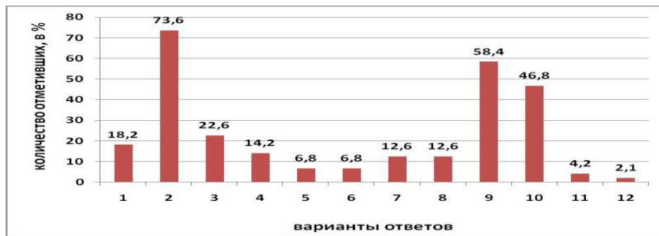
Figura 2 – Opinião de especialistas sobre o problema da procura de qualquer ajuda junto das instituições de proteção social e serviço social por parte de idosos e pessoas com deficiência

Legendas: 1 – problemas médicos e sociais (declínio da saúde, agravamento da condição aguda de doenças, diminuição da atividade física), 2 – problemas financeiros, 3 – problemas de moradia, 4 – problemas sociopsicológicos (sentir-se abandonado, inútil, solitário, perda de sentido da vida; vulnerabilidade, distração, perda de autoconfiança, solidão), 5 – declínio na atividade social, 6 – dificuldades de adaptação à aposentadoria, 7 – gestão de atividades de lazer, 8 – problemas nas relações com os filhos (ou outros parentes próximos), 9 – dificuldades sociais e de vida (trabalho doméstico, compra de alimentos, etc.), 10 – problemas sociais e legais (ignorância das mudanças legislativas, etc.), 11 – ignorância do uso das conquistas da revolução tecnológica (Internet, comunicação móvel, princípios de funcionamento dos cartões plásticos, etc.), 12 – os demais.