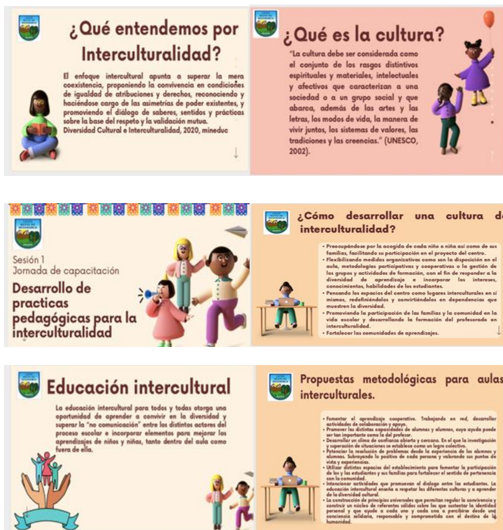
Figura 2 – Capacitación docente