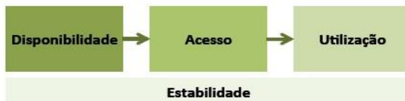
Figura 1 - Dimensões da SAN

Para a FAO (2014) a SAN apresenta quatro dimensões, conforme a figura 1: