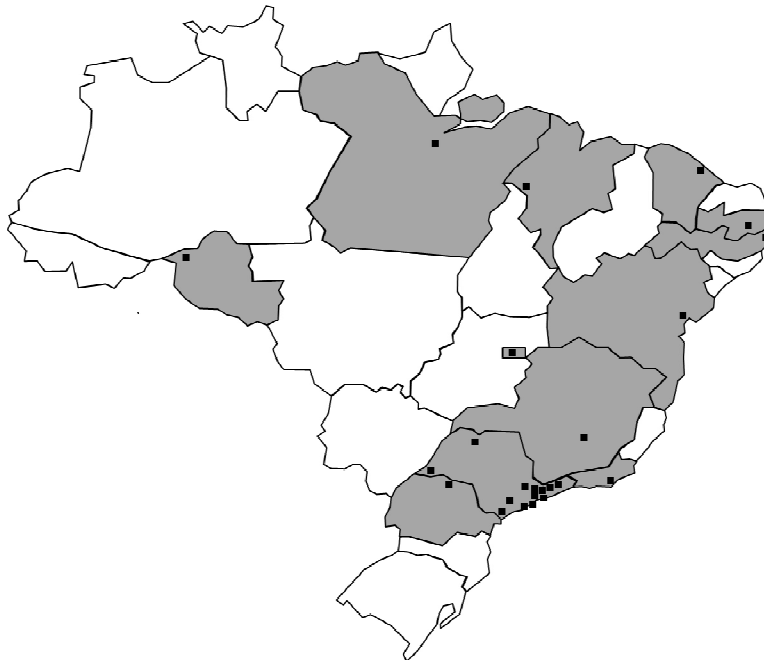
Figura 1 Polos de Apoio Presencial do CST em Gestão Pública

As teleaulas ocorrem ao vivo e os estudantes assistem-nas nos polos. Durante e aula, é possível que o estudante envie questionamentos, dúvidas e/ ou comentários ao professor, que, portanto, interage com esse discente em tempo real, permitindo a troca de experiências ao vivo e fortalecendo a relação docente-discente. Além disso, são distintas e variadas as intervenções discentes durante as aulas, oriundas de todos os polos de apoio presencial da universidade, o que, mais uma vez, é reflexo da diversidade tão característica do curso.